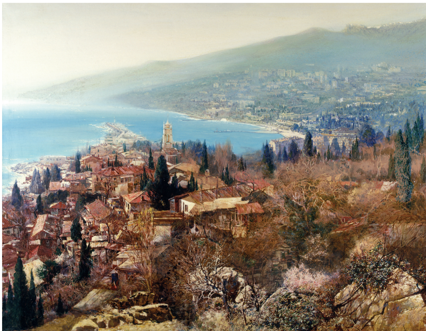
Сергей БОЧАРОВ (Москва). Вид на Ялту с Поликуровского холма. http://www.botcharov.ru/